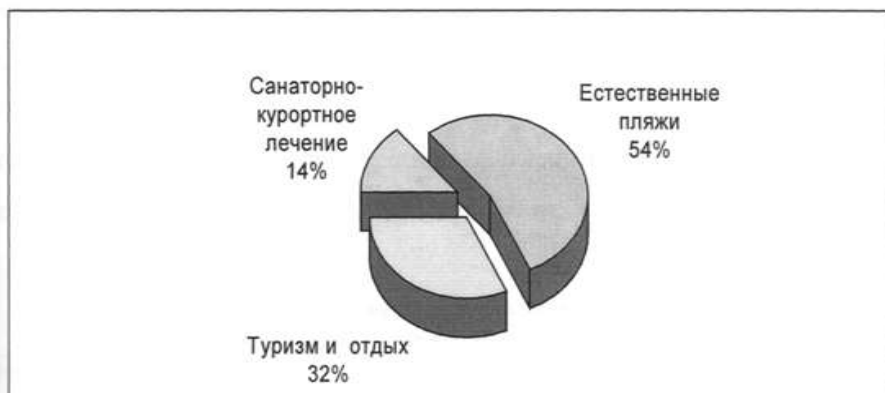
Рис.2 Природно-рекреационный потенциал Иссык-Кульского региона

Основными природно-рекреационными ресурсами в Иссык-Кульской области являются естественные пляжи, условия для горного туризма, минеральные воды и лечебные грязи (рис 1.). Природно-рекреационный потенциал Иссык-Кульского региона наиболее широко изучен в экономико-географическом аспекте.