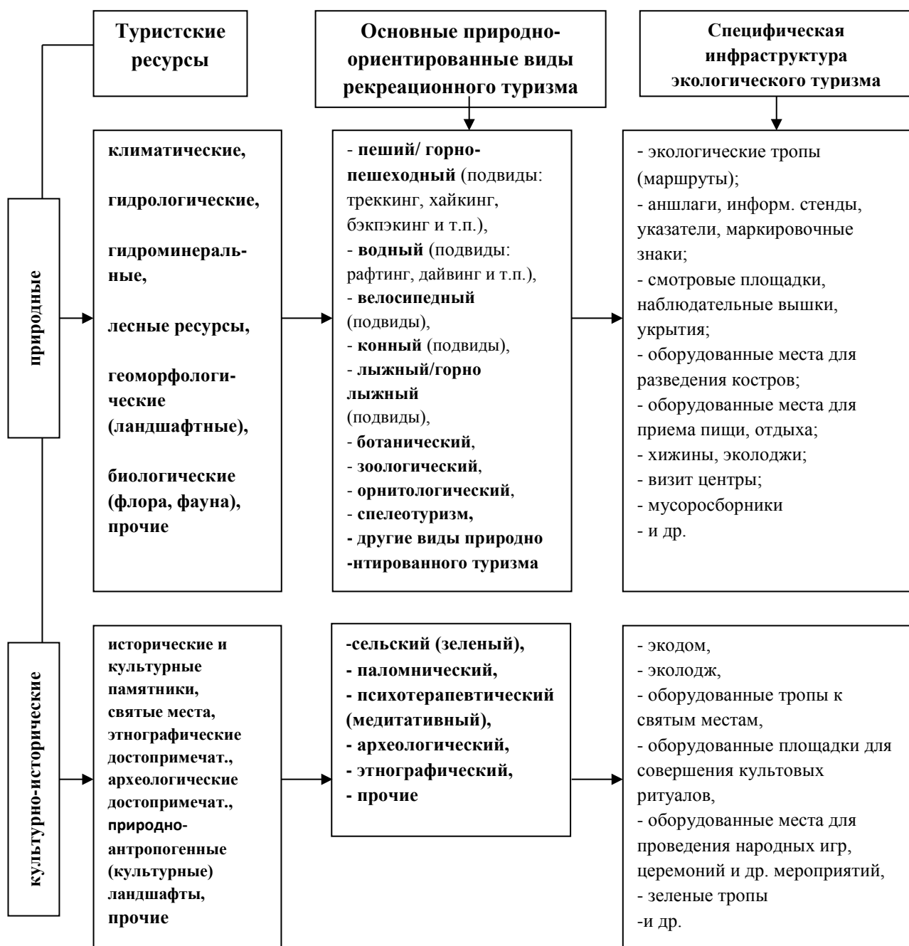
Рис. 2. Специфическая структура экологического туризма [разработано автором]

К специфической инфраструктуре экологического туризма мы отнесли экологические тропы и необходимое к ним оборудование (аншлаги, информационные щиты, указатели), оборудованные места для отдыха, приема пищи, разведения костров, проведения народных игр, церемоний, культовых ритуалов, а также средства размещения туристов – экодома, эколodge, хижины для ночевки на маршруте.