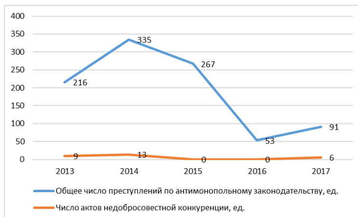
Рисунок 2. Динамика выявленных нарушений антимонопольного законодательства России и численности актов недобросовестной конкуренции в 2013-2017 гг.*

Примечательно, что вопросы недобросовестной конкуренции уже отчасти внесены в документацию ЕАЭС с тем, чтобы контролировать это противоречивое явление не только на национальном уровне, но и на уровне всего союза в целом.