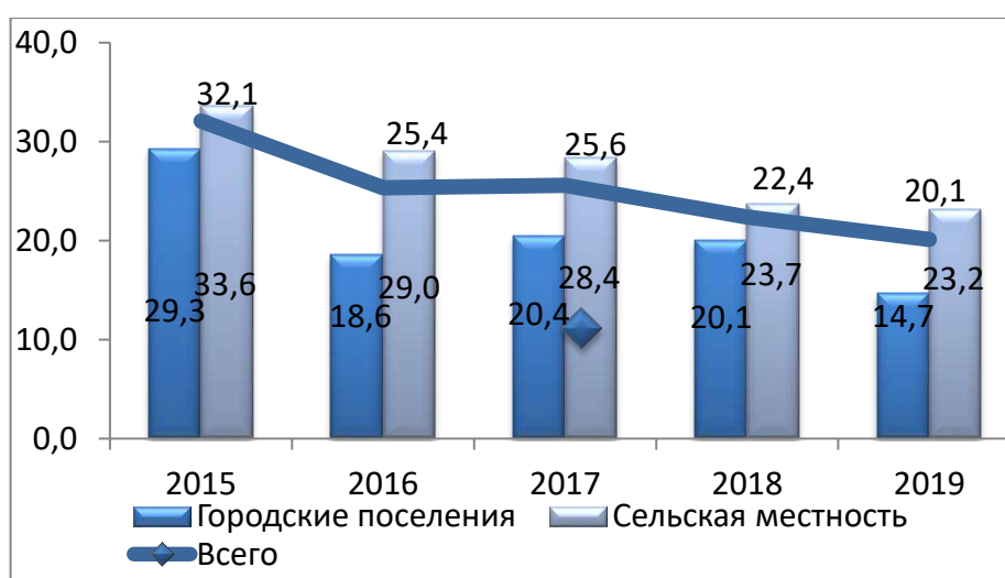
Рис. 1. Уровень бедности по месту проживания (в % к общей численности населения)

Уровень бедности в городских поселениях снизился на 5,4 %, а в сельской местности - на 0,5 %. За чертой бедности в 2019 году проживали 1 млн. 313 тыс. человек, из которых 73,8 % являлись жителями сельских населенных пунктов (рис. 1) [3].